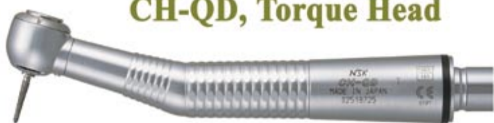
CH-QD, Torque Head

Speed of 350,000rpm Clean Head, Ultra Push Chuck Ceramic Ball Bearings, Single Spray