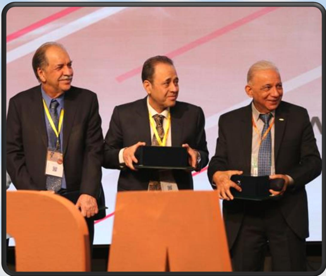
مراسم تقدیر و تجلیل از کمیته نمایشگاه کنگره هفدهم