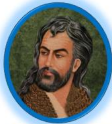
سالن حافظ سینما ۱

جهت مشاهده جدول برنامه علمی هفدهمین کنگره علمی سالیانه انجمن دندانپزشکان عمومی ایران روی پوستر زیر کلیک نمایید.