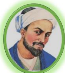
سالن سعدی سینما ۳