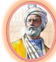
سالن فردوسی کنسرت