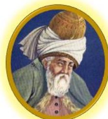
سالن مولوی سینما ۲