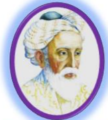
سالن خيام سینما ۴